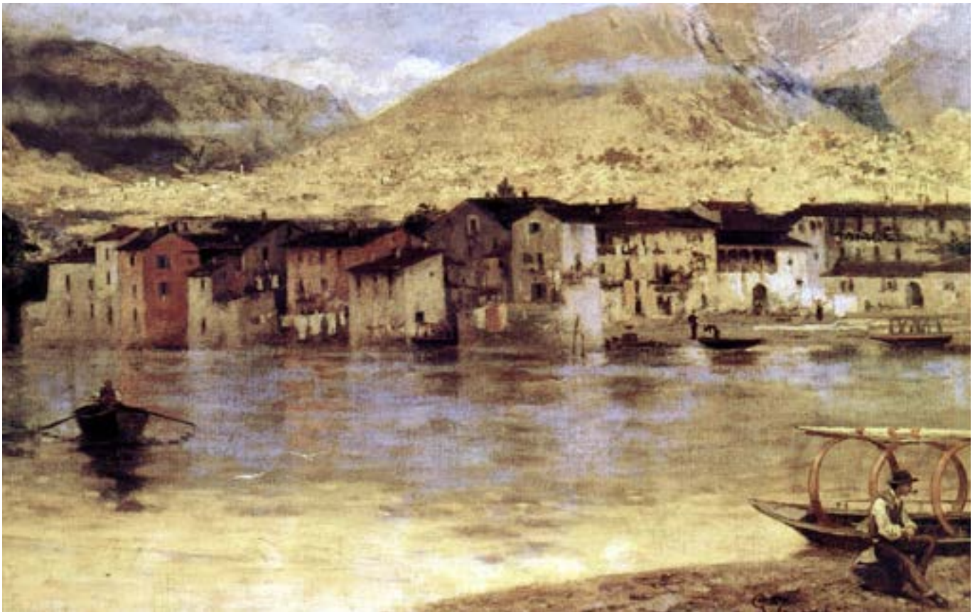
Giovanni Battista Todeschini, Pescarenico , 1885, olio su tela, cm 70 x 120, Collezione privata

Anno XXXVI n. 115-116 I e II Quadrimestre 2023