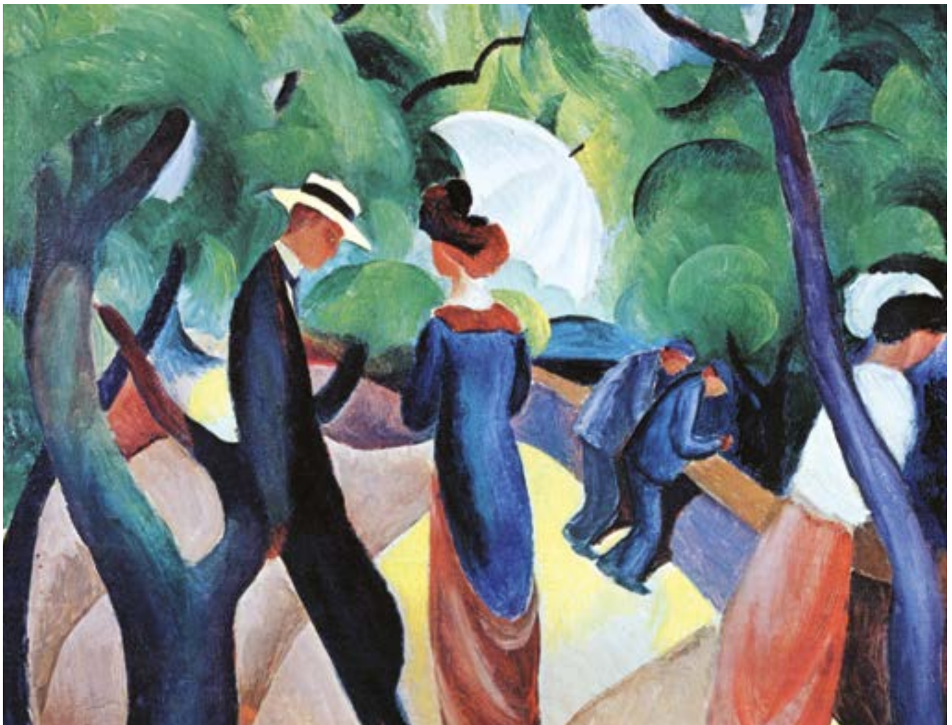
August Macke, Promenade , 1913, olio su cartone, cm 51 x 57, Monaco di Baviera, Lenbachhaus