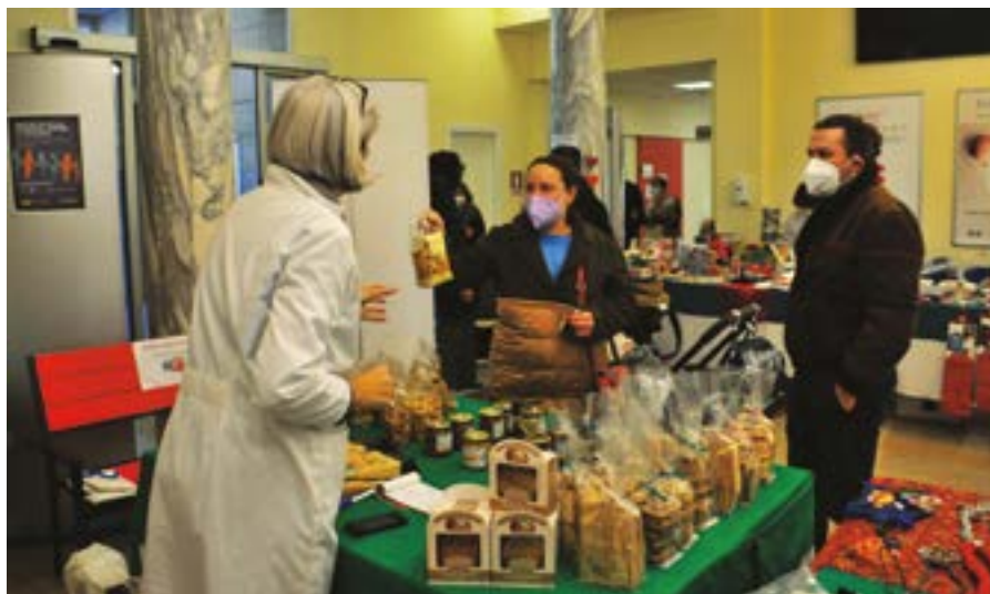
L'atrio della Melloni, sempre affollato di mamme, papà, coppie e famiglie, ha ospitato le bancarelle del mercatino Vozza: gastronomia, bigiotteria, prodotti per le mamme e per l'infanzia sono stati tutti molto apprezzati

gni di una vera stenna. A volte anche preparandoli in prima persona o andandoli a scovare nei posti più impensati. Che siano abiti, confezioni, complementi d'arredo o specialità gastronomiche tipiche, magari difficilmente reperibili al di fuori delle aree di produzione. Oppure lavorazioni artigianali uniche ed esclusive. A consuntivo possiamo aggiungere che i due mercatini sono andati molto bene. Da tutti i punti di vista: per i ricavi e la soddisfazione degli utenti che hanno affollato le bancarelle e trovato sempre ciò che era di loro gusto. Molto importante anche il ritorno in massa del personale sanitario che ha potuto sfruttare i momenti di pausa dal lavoro per visitare i banchetti.